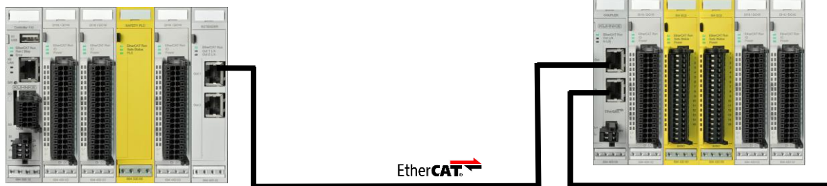
Kuhnke FIO-Steuerung mit Sicherheits-SPS